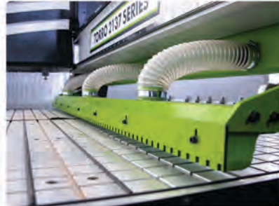
Otomatik Süpürme ve Plaka Transferi ( Opsiyonel )