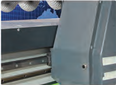
Çarpma Güvenliği Sensörü ( Opsiyonel )