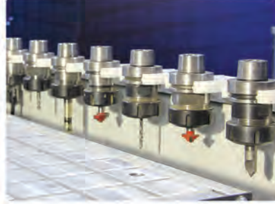
Takım Magazin ( 14 adet )