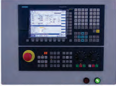
Kontrol Paneli ( Siemens )